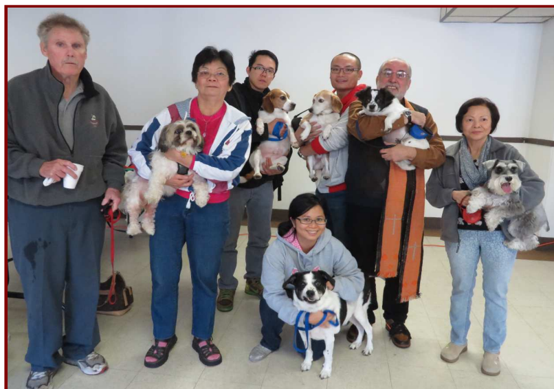
本堂於 10 月 5 日首次舉辦降福家寵。教友們帶同他們的愛犬參與。

聖女貞德的英勇事蹟，印證了殉道者對天主的堅持和執着，此外，上述的這些女性對聖召的火速回應，給了我們極佳的榜樣，在平凡中活出不平凡，隨時準備接受作天主的工具。誠如聖保祿宗徒對信徒的訓導：「神恩雖有區別，卻是同一的聖神所賜；職份雖有區別，卻是同一的主所賜；功效雖有區別，卻是同一的天主，在一切人身上行一切事。」你，尤其是女性的讀者，讀畢這篇文章後，對天主的召叫將作出怎樣的回應呢！